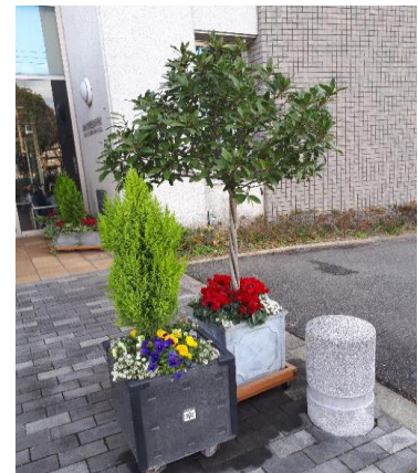
[正面玄関前のコンテナ]