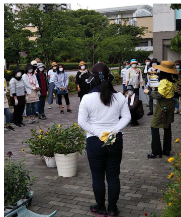
[ワンポイントレッスン]