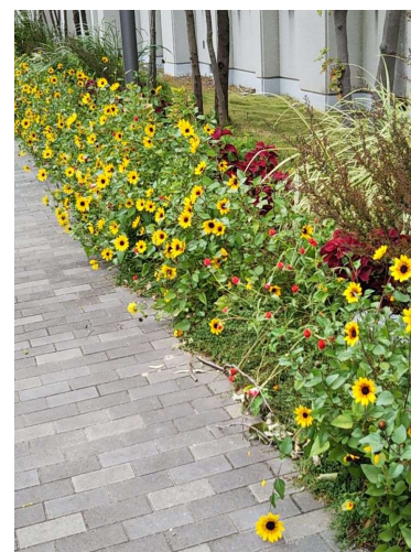
[サンビリーバブルの花壇]