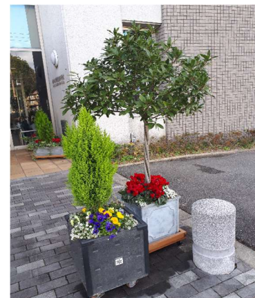
[正面玄関前のコンテナ]