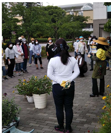
[ワンポイントレッスン]