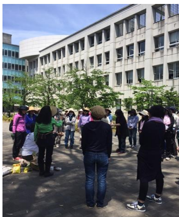
[ワンポイントレッスン]