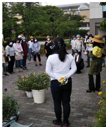
[ワンポイントレッスン]