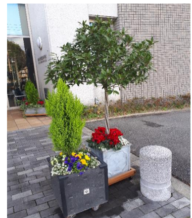
[正面玄関前のコンテナ]