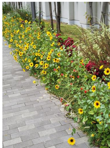
[サンビリーバブルの花壇]