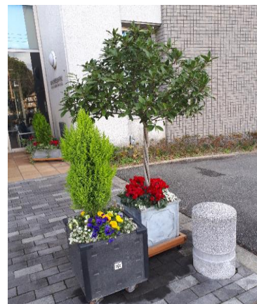
[正面玄関前のコンテナ]