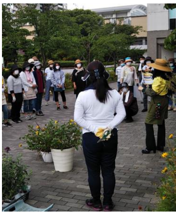
[ワンポイントレッスン]